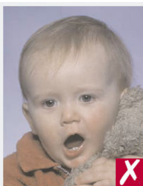
Bouche ouverte et présence d'un jouet