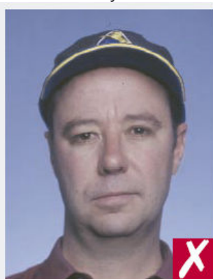
Port d'une casquette