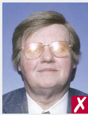
Reflets sur les verres