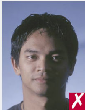
Ombres sur le visage