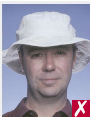
Port d'un chapeau

Les montures ne doivent pas être trop épaisses ni masquer ses yeux.