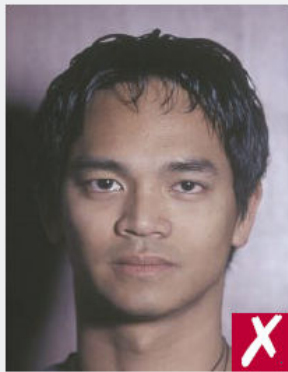
Ombres sur le fond

Présenter un éclairage uniforme, ne générant ni marque de flash, ni yeux rouges, ni ombre.