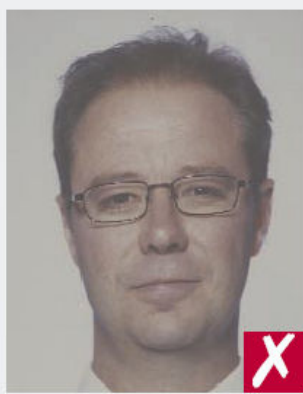
Couleurs trop fades

Etre imprimées sur du papier photo de qualité et avec une haute résolution.