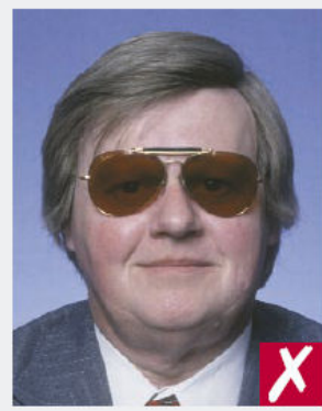
Verres trop teintés