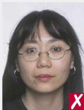
Montures masquant les yeux