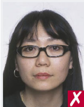
Montures trop épaisses

La photo doit laisser clairement voir ses yeux (pas de verres trop teintés, ni de reflets).