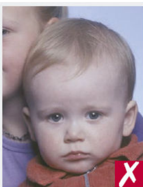
Présence d'une autre personne