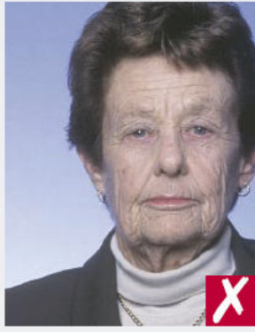
Photo non centrée