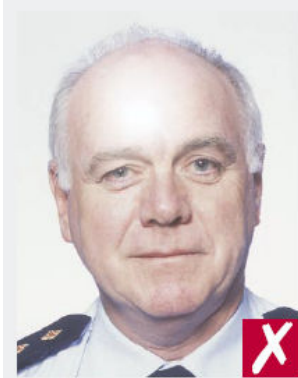
Reflet du flash sur la peau

Avoir un fond de couleur unie et claire.