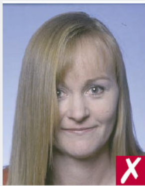
Cheveux sur le visage