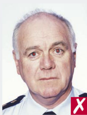
Yeux rouges dus au flash